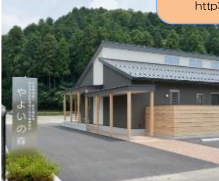
◎グループホーム やよいの森 TEL : (0776) 34-5112 〒918-8021 門前1丁目120番

〒918-8055 福井市若杉2丁目601番地 TEL (0776)34-5100 FAX (0776)34-5101 http://www.aijuen.com/ Eメール mail@aijuen.com