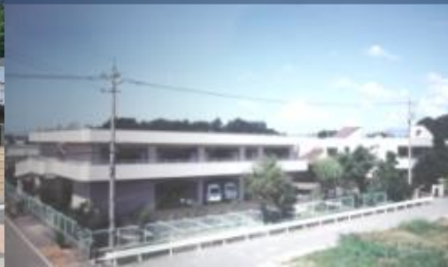
◎特別養護老人ホーム 愛寿苑 ◎ショートステイ 愛寿苑 TEL : (0776) 34-5100 〒918-8055 若杉2丁目601番地