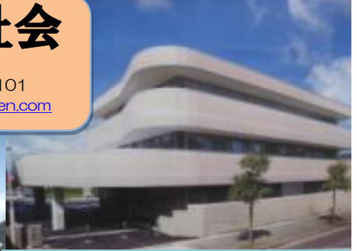
◎愛寿苑デイサービスセンター TEL : (0776) 33-6767 ◎愛寿苑居宅介護支援センター ◎愛寿苑在宅介護支援センター TEL : (0776) 34-5252 ◎小規模多機能型居宅介護 やよいの里 TEL : (0776) 33-7474 〒918-8058 加茂緑苑町402番地